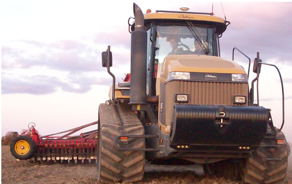
Bild: Challenger med Leica mojoRTK autostyrning