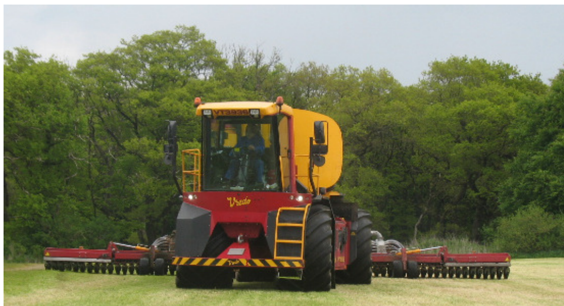
Bild: Vredo myllare i "Dog Walk" med Leica mojoRTK och Quick Steer

Väljer du hydraulisk integration så ökar installationskostnaden (35 000-70 000 kr) men autostyrningen får något snabbare reaktionsförmåga. En rattlösning (ca 17 000kr) är billigare och kan dessutom installeras på alla maskiner som har ratt, tex självgående hackar, tröskor och redskapsbärare mm, se bild nedan.